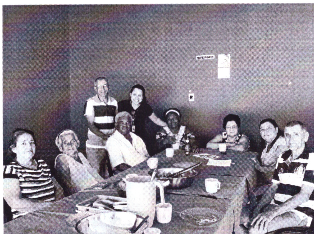
- Almoço com os usuários -

Rua Cerqueira César, nº 295, Jardim América – CEP.: 15607-024 - Fernandópolis-SP