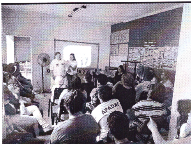
- Palestra outubro rosa -

Rua Cerqueira César, nº 295, Jardim América – CEP.: 15607-024 - Fernandópolis-SP