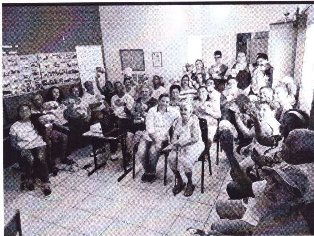
- Palestra outubro rosa –