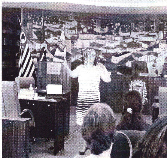
- Palestra em comemoração ao Dia Nacional do Surdo –

Rua Cerqueira César, nº 295, Jardim América – CEP.: 15607-024 - Fernandópolis-SP