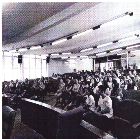
- Palestra em comemoração ao Dia Nacional do Surdo –